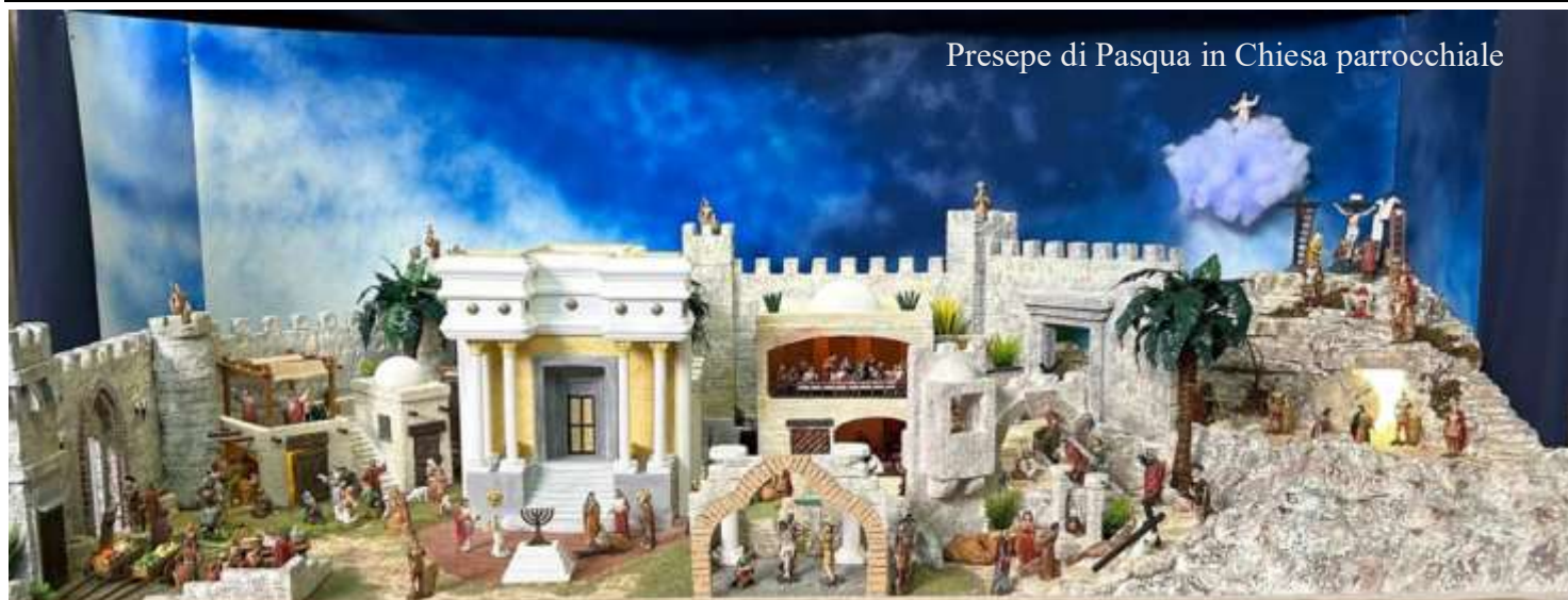
Presepe di Pasqua in Chiesa parrocchiale